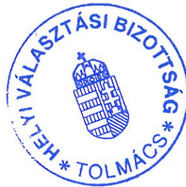
Szombati Erika választási bizottság elnöke