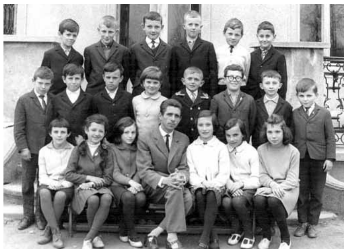
Három fotó Tolmács múltjából