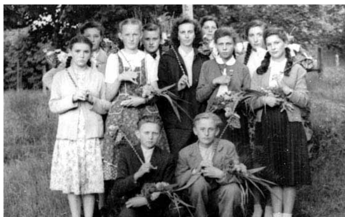
Fotók Tolmács múltjából - Viczián Lászlóné gyűteményéből