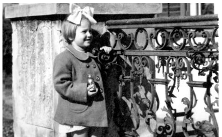
Fotók Tolmács múltjából