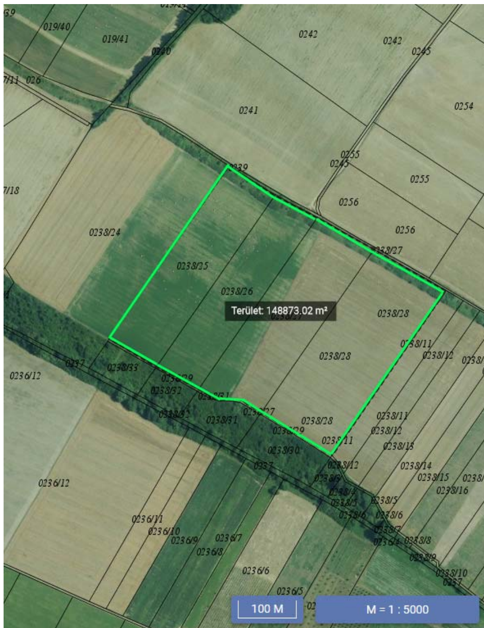
1. ábra - Kiválasztott területek

A beruházás megvalósításához, illetve engedélyeztetéséhez elengedhetetlen a Településrendezési terv módosítása. Amennyiben a közeljövőben nem terveznek rendezési tervet módosítani rendes eljárásban, úgy célszerű az egyszerűsített, tárgyalásos eljárásban lefolytatni a módosítást.