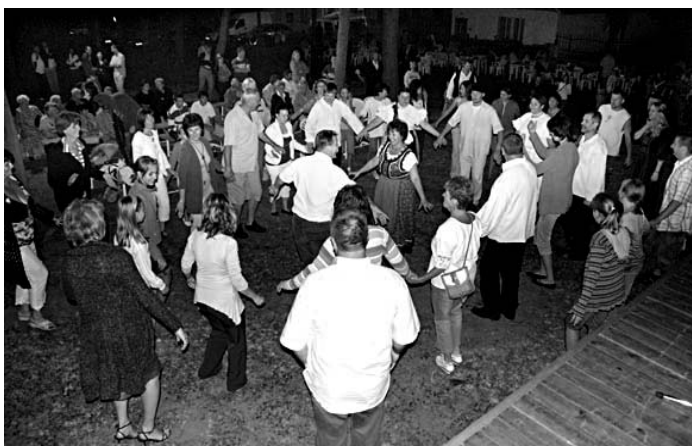
Emlékképek a 15 éve tartott első falunapról